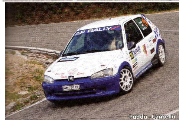
Puddu - Cancellu