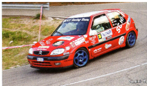
Contini - Zara