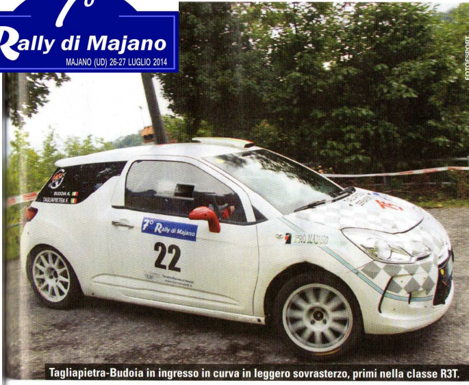
Tagliapietra-Budoia in ingresso in curva in leggero sovrasterzo, primi nella classe R3T.

7° Rally di Majano MAJANO (UD) 26-27 LUGLIO 2014