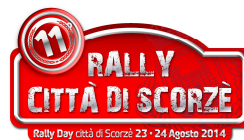
Rally Day città di Scorzè 23 - 24 Agosto 2014